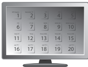
Ukázka řazení programů od výrobce TV přijímače Philips

Po úvodním 10denním období budou dostupné programy podle smluvně sjednané programové nabídky. Podle softwaru TV přijímače je řazení programů dáno výrobcem TV přijímače nebo řazením platným pro Mediaboxy UPC.