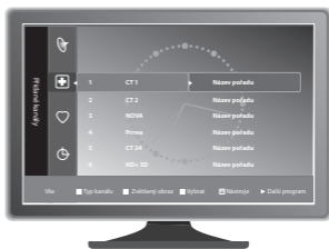
Ukázka řazení programů od výrobce TV přijímače Samsung