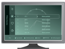
Ukázka řazení programů od výrobce TV přijímače Samsung