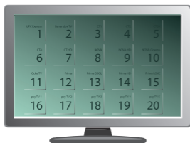
Ukázka řazení programů od výrobce TV přijímače Philips

Po úvodním 10denním období budou dostupné programy podle smluvně sjednané programové nabídky. Podle softwaru TV přijímače je řazení programů dáno výrobcem TV přijímače nebo řazením platným pro Mediaboxy UPC.